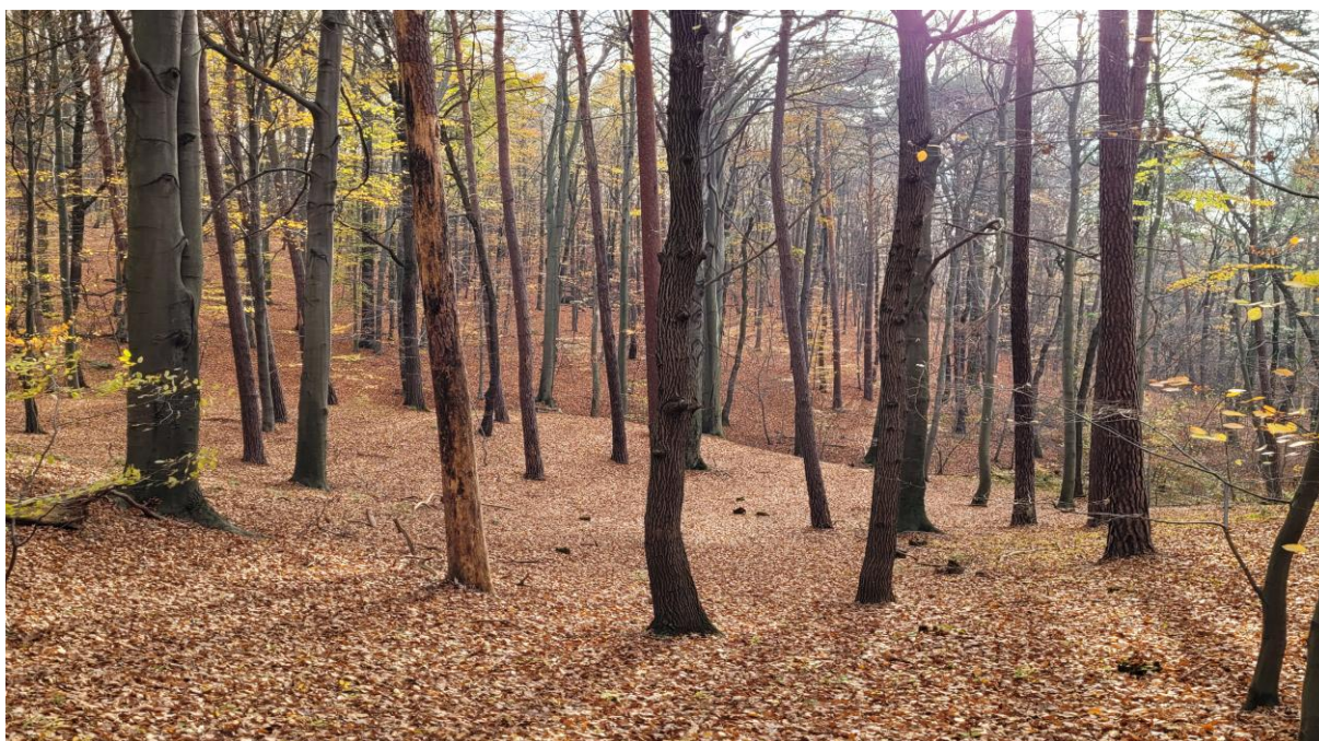
Urozmaicona rzeźba terenu z lasem bukowo-sosnowym