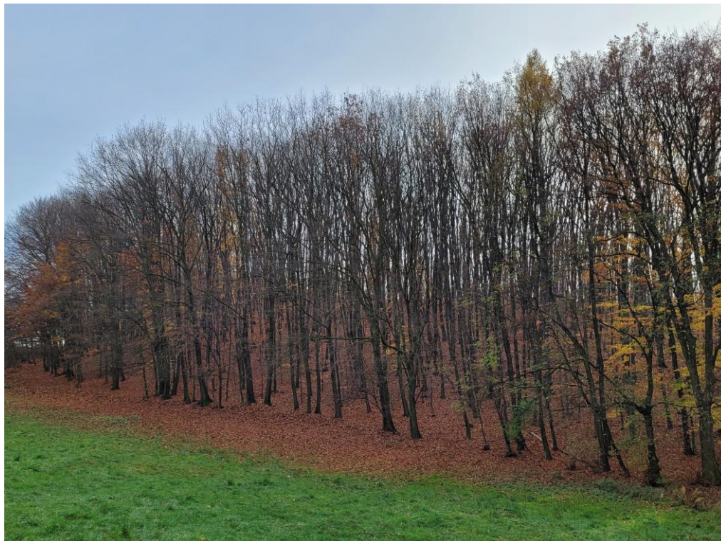
Siedlisko buczyny